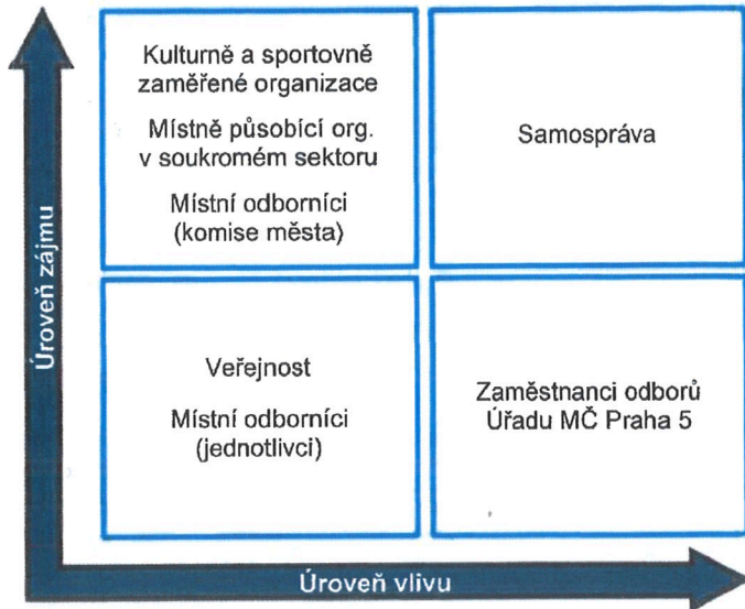
Schéma 2 Matice vlivů a zájmu zainteresovaných stran