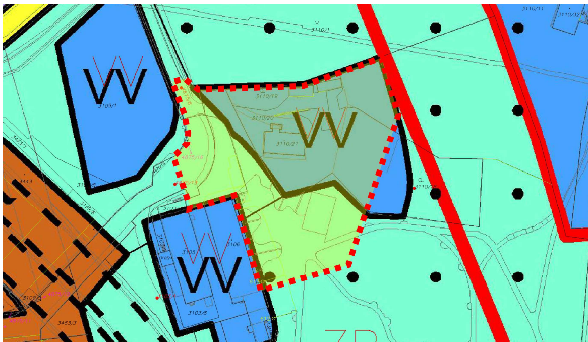
Zákres řešeného území do Územního plánu sídelního útvaru hl. m. Prahy