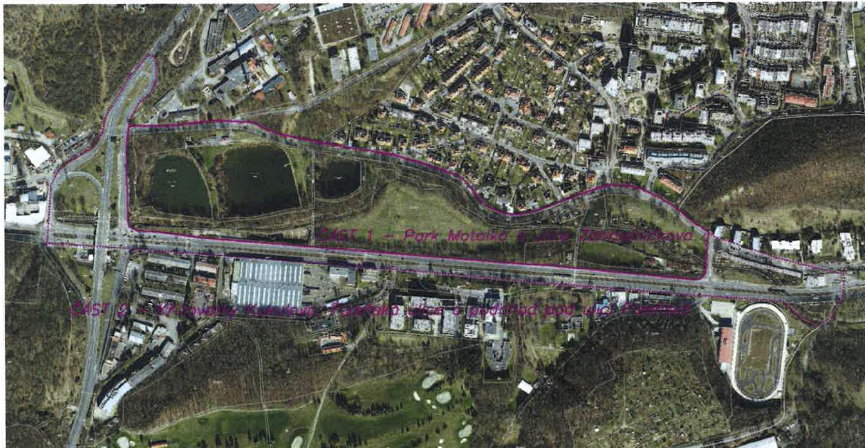
Zákres řešeného území do ortofotomapy 1