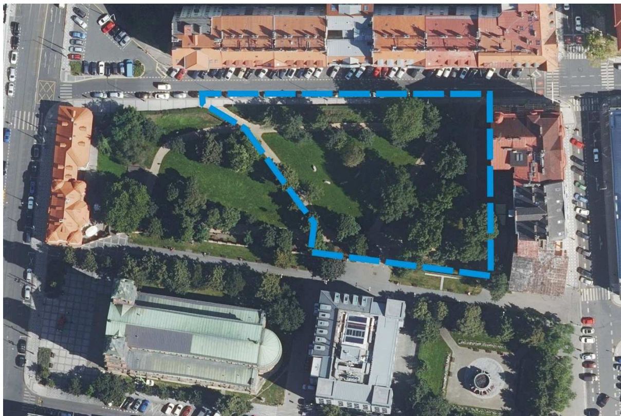
Ortofotomapa parku s cestní sítí a vyznačením území pro umístění díla

Dílo není možné umístit na štítovou zeď domu v Matoušově ulici 1286 / 5.