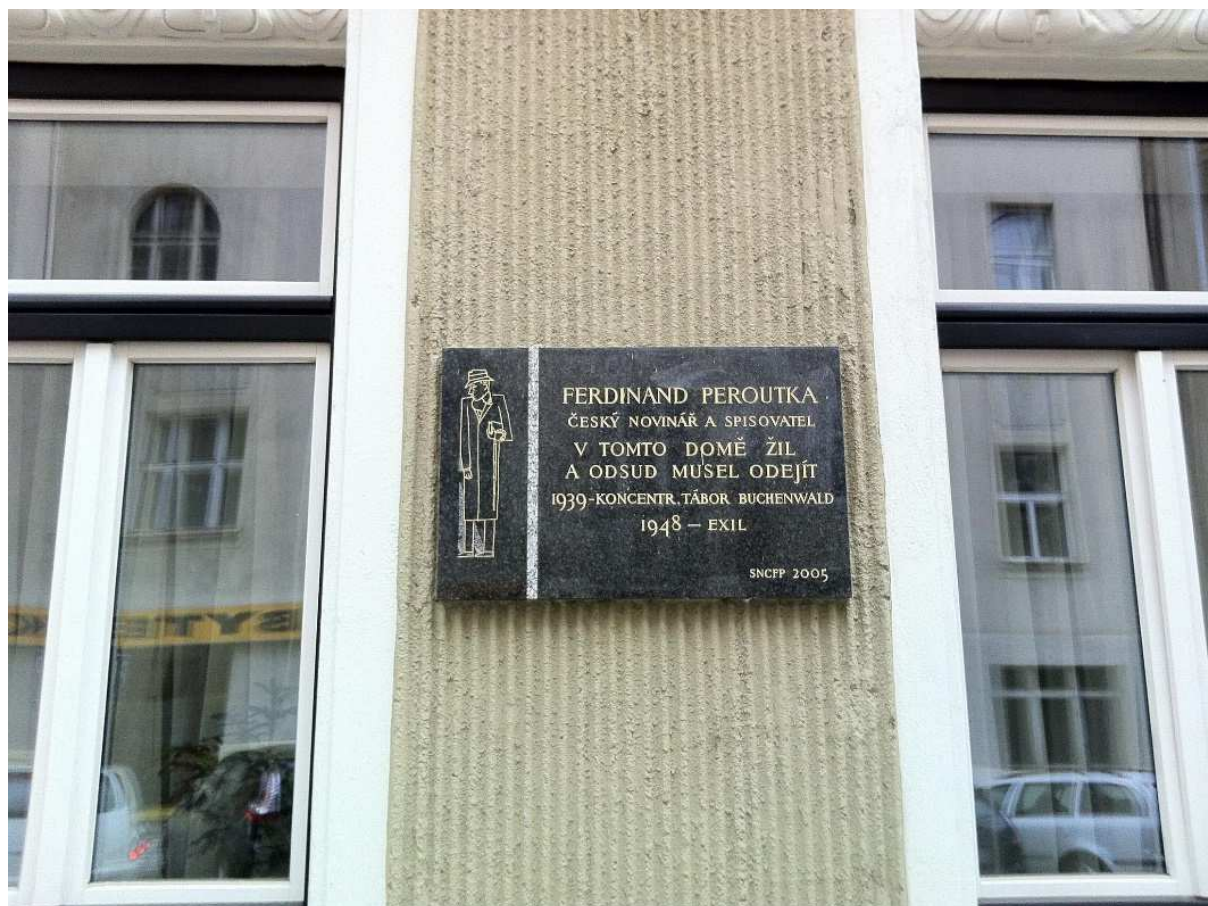
Pamětní deska F. Peroutky na domě v domě v Matoušově ulici 1286 / 5