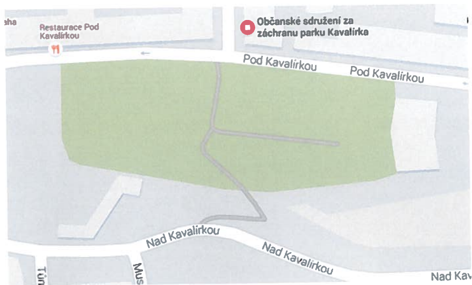
Obrázek 2: Park Kavalírka